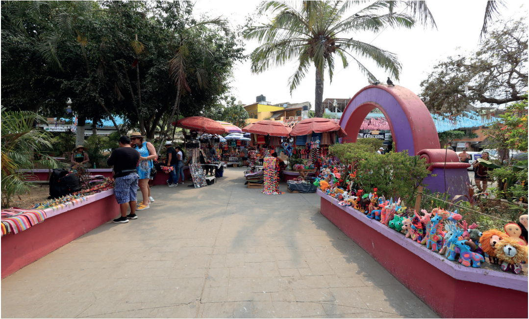
Figura 7. Inmigrante vendiendo artesanías a turistas en la plaza principal

Autor: Jonathan Marrujo Galván (fotografía tomada el 3 de mayo de 2023).