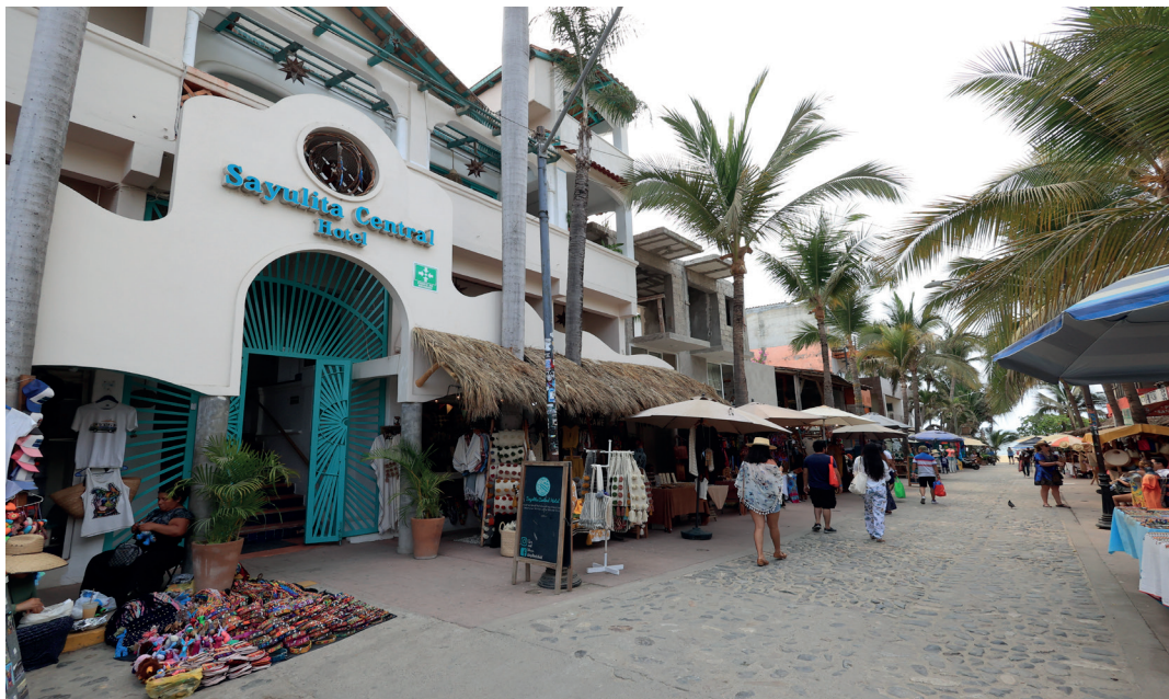
Figura 6. Inmigrantes indígenas ofreciendo sus artesanías en el comercio informal