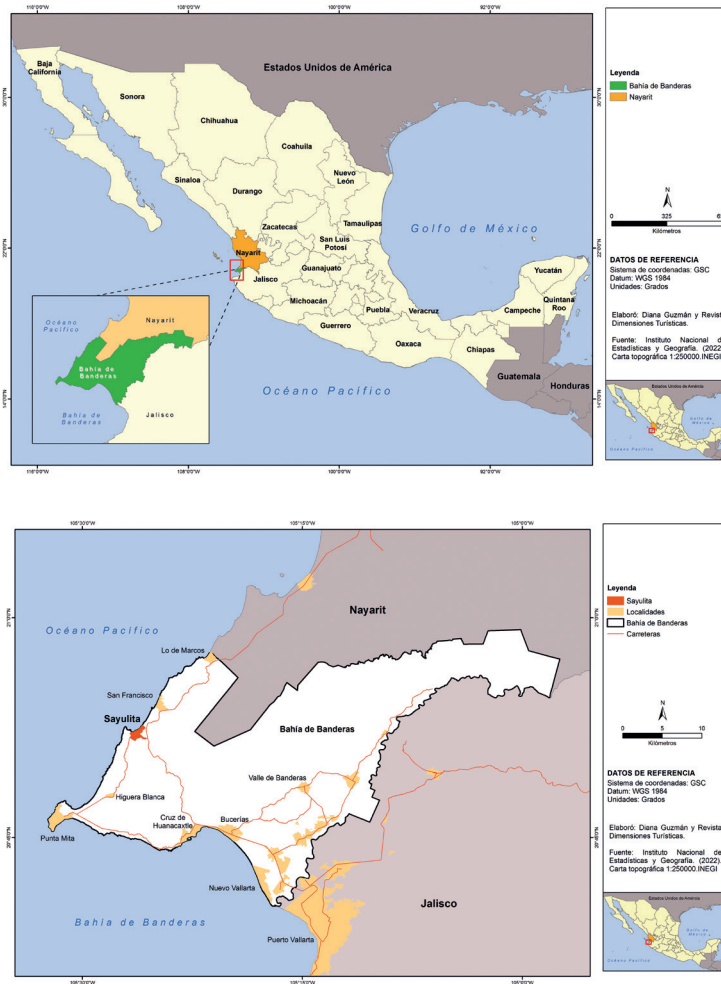
Figura 3. Localización geográfica de Bahía de Banderas y Sayulita, Nayarit

Fuente: Elaborado por Diana Jatziri Guzmán Báez y Dimensiones Turísticas (12 de junio de 2024).