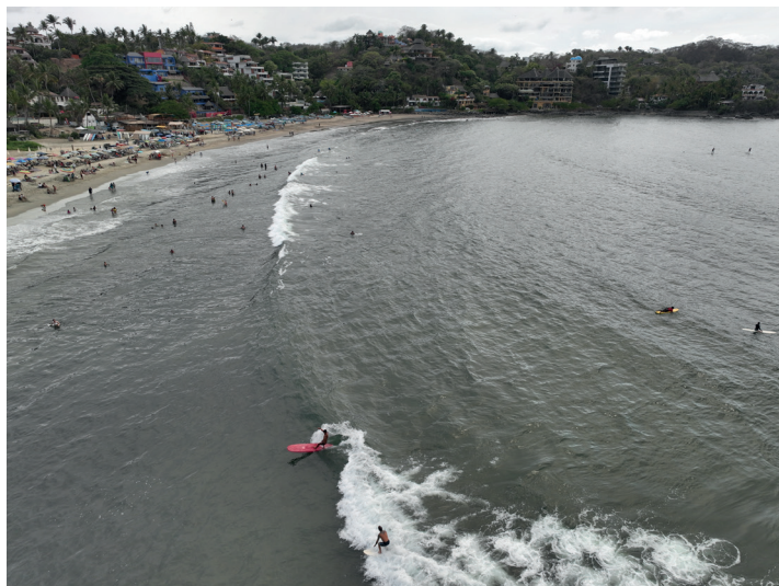
Autor: Jonathan Marrujo Galván (fotografía tomada el 3 de mayo de 2023).

Entonces, ejidatarios del Ejido de Sayulita y otros pobladores de la localidad iniciaron el proceso de venta de sus tierras y viviendas a desarrolladores y turistas, por lo que tanto el paisaje de Sayulita como la dinámica comunitaria se fueron transformando con la creación de infraestructura turística y viviendas de extranjeros, que sistemáticamente se han incrementado al construirse incluso en áreas otrora consideradas marginales. El turismo generó un incremento del empleo sobre todo en la industria de la construcción, y con ello atrajo inmigración, que propició cambios demográficos en el municipio de Bahía de Banderas y la localidad, como se aprecia en las tablas que a continuación se presentan.