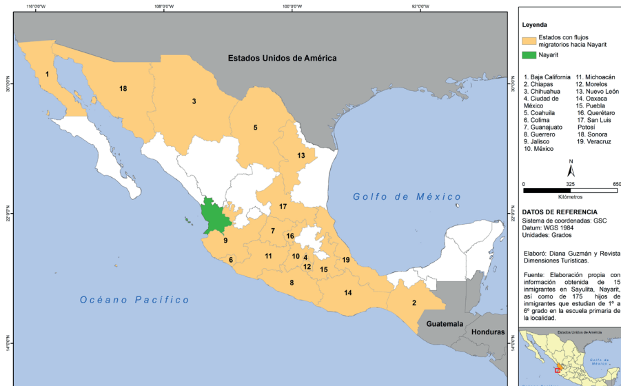
Figura 5. Entidades de la República mexicana expulsoras de población hacia Bahía de Banderas, Nayarit